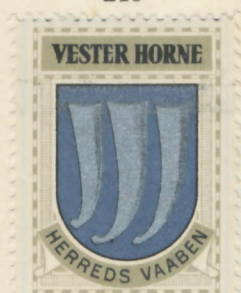
Vester Horne Herred

Varde Landsogn, Janderup, Billum, Lunde, Ovtrup, Kvong, Nørre-Nebel, Lydum, Henne, Lønne, Aal, Ho, Oksby.